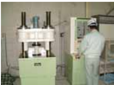
コンクリート試験

但し、JIS A 1108:2006付属書のアンボンドキャッピング、JIS A 1145:2007の質量法、原子吸光光度法は除く。