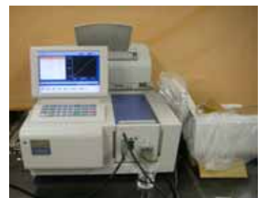
アルカリシリカ反応試験